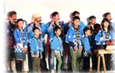
息ぴったりの各区の子ども祭り太鼓