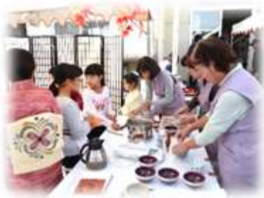
子ども茶道教室のお点前（おもてなし） お客様の笑顔がうれしいです