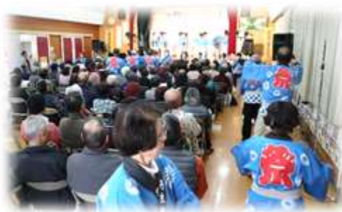
前日祭オープニングで新丹生音頭初披露

記念すべき10回目のふるさと祭りは、多くの方のご協力の下、無事に終了することができました。みなさま、ありがとうございました！