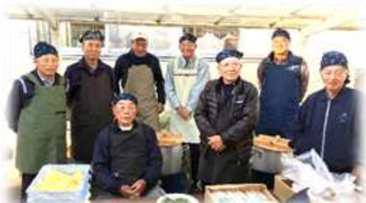
毎回大好評のおもてなし 男性料理教室の豚汁コーナー