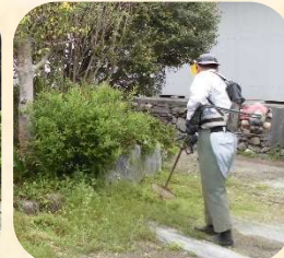
初めてのお助け隊作業 お疲れ様でした