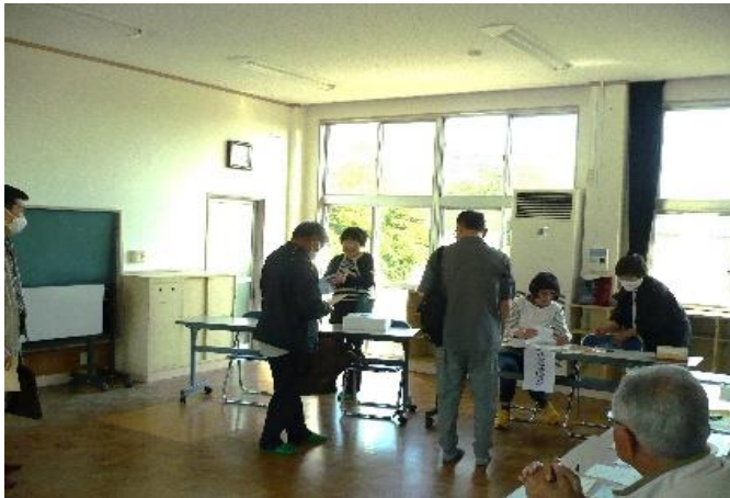
※各自治会からの負担金の納付の様子です

第31号 令和 6年 6月 発行：寒田校区まちづくり協議会 事務局：寒田校区公民館内 電話：097-568-9442 勤務日：月水金 9：00～16：00